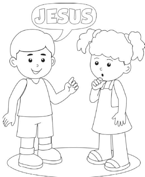
FALANDO DE JESUS